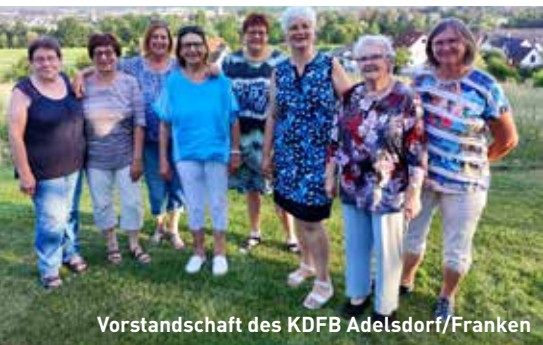
Vorstandschafft des KDFB Adelsdorf/Franken

Voller Dankbarkeit berichtete sie aber auch über die vielfältige Hilfe und Unterstützung, die oft von unerwarteter Seite erfolgte. Dies war auch der Fall bei der überraschenden Spende des Frauenbundes Adelsdorf in Franken. Nach den Fernsehberichten über die Hochwasserkatastrophe in Günzburg nahm dieser Kontakt zum Günzburger Frauenbund auf und bot seine finanzielle Hilfe an.