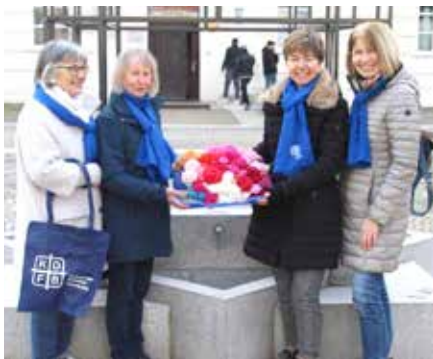
Teilnahme am Internationalen Frauentag „Roses4rights“ im März 2024

„Ich stehe auf für den Frauenbund, weil er sich für die Gleichberechtigung der Frauen einsetzt.“