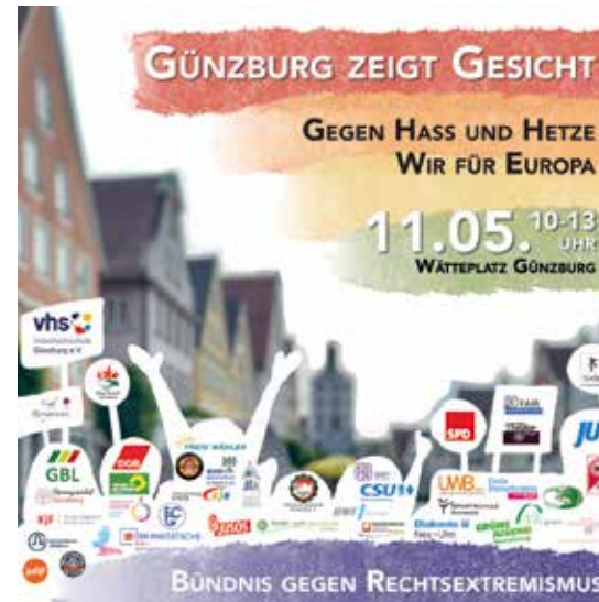
Das war das Plakat für die dritte Veranstaltung des Bündnisses gegen Rechtsextremismus.